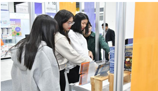
※ 상기 이미지는 연출사례입니다.

- 대한민국 식품대전의 핵심 콘텐츠를 빠짐없이 즐기며 바우처도 받을 수 있어 일석이조!