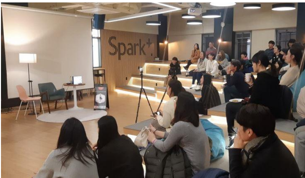
※ 상기 이미지는 연출사례입니다.