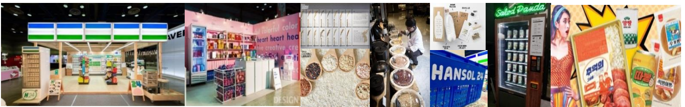
※ 상기이미지는 연출사례입니다.