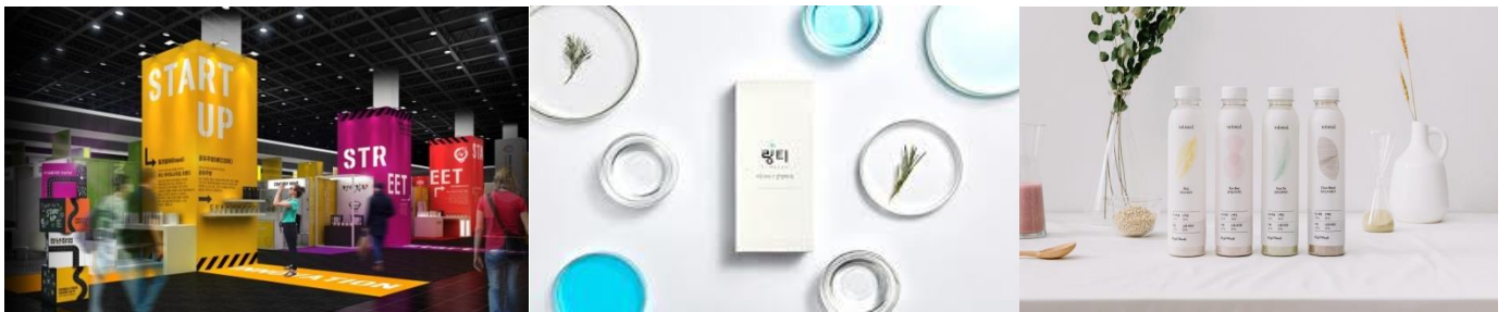
※ 상기이미지는 연출사례입니다

- 스타트업 제품을 모아 놓아 최신 식품산업 트렌드와 빛나는 아이디어를 볼 수 있는 전시 공간